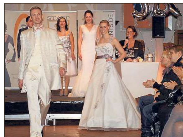
Auch der Bräutigam darf in Weiß gehen – wenn's denn gefällt. Die Modenschau bot viele Ideen.