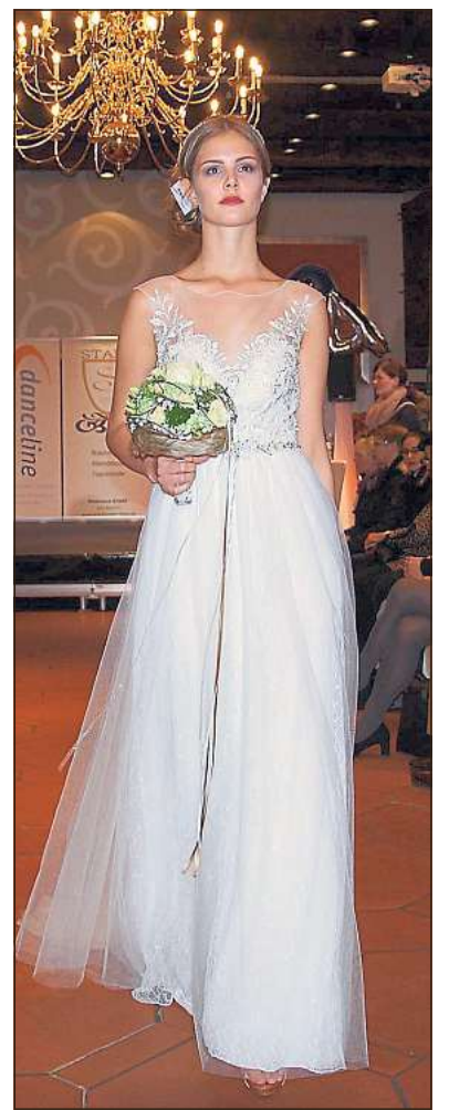
Ein Traum aus Tüll mit besticktem Oberteil: Schmale Silhouetten sind im Trend.

Bei den Herren ist der „royale Look“ angesagt. Fliege, Hosenträger, Einstecktuch und lange Jacketts in den Farben Braun, Dunkelblau und Grau, bevorzugt in leicht glänzenden Nuancen, sowie edles Schuhwerk machen den Bräutigam reif für die eigene Hochzeit. Auf dem Laufsteg wurde dem Publikum indes nicht nur Brautmode und Festtagskleidung präsentiert. Blumendekorationen, Schmuck und festliche Frisuren waren ebenfalls immer wieder Hingucker.